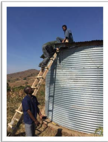
Inspectie van de watertank uit 2015 in Kilangala